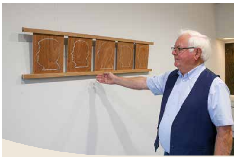
Keus laat de tinnen silhouetten van de collegeleden zien

Vanaf het voorjaar maakt Keus silhouetten van tin. "Ik kijk altijd naar nieuwe dingen en heb elke dag wel een idee. Zo zijn ook de tinnen silhouetten ontstaan. Dan ga je oefenen en na een tijdje heb je het onder de knie. En dan zoek je natuurlijk naar mogelijkheden om