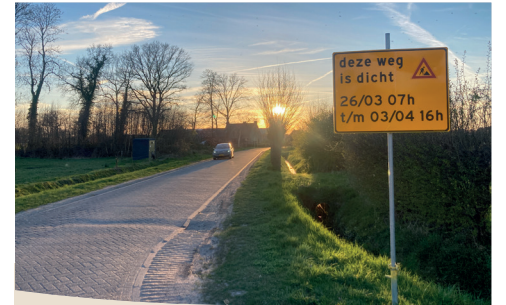
Aankondiging voor het verleggen van kabels en leidingen aan de Meskampersteeg

De Meskampersteeg tussen de Nijkerkerstraat (klinkergedeelte) en de Tintelersteeg krijgen groot onderhoud. We vernieuwen de hele rijbaan. De stenen vervangen we door asfalt en we passen maatregelen toe om de snelheid te verlagen. De uitrit naar de Nijkerkerstraat maken we breder. Ook pakken we de berm aan. Van 26 maart tot en met 3 april worden de kabels en leidingen verlegd. De reconstructie start op maandag 13 april en duurt tot eind mei.