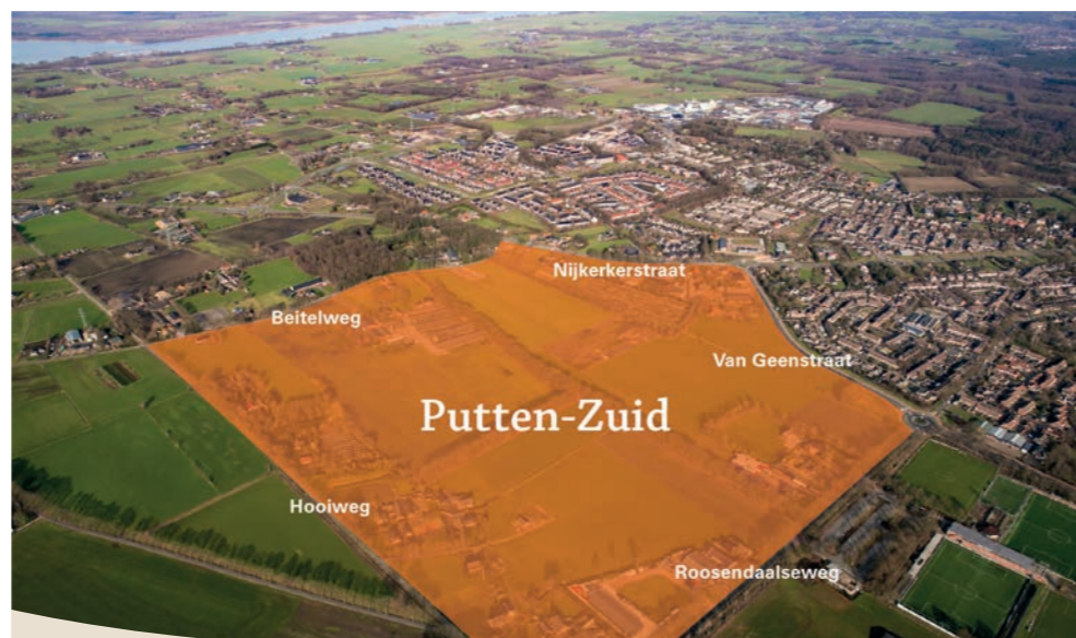
De Nijkerkerstraat, Van Geenstraat, Roosendaalseweg, Hooiweg en Beitelweg omsluiten de woningbouwlocatie Putten-Zuid.